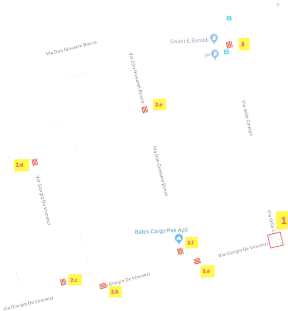
Figura 1 - Mappa riassuntiva delle proposte di adeguamento viabilità