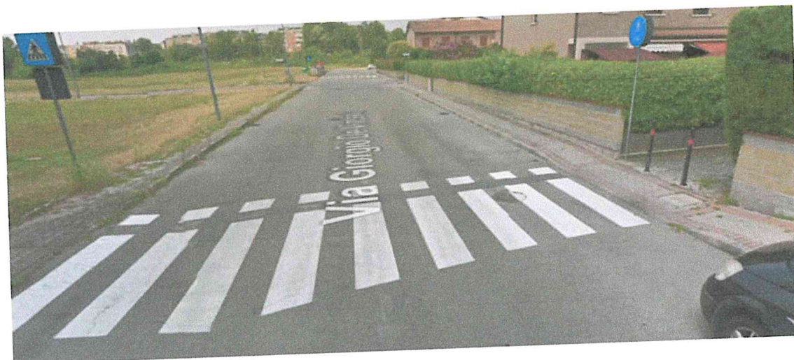
Figura 3 - (2b) Vista attuale passaggio pedonale presso via De Vincenzi n. 18.