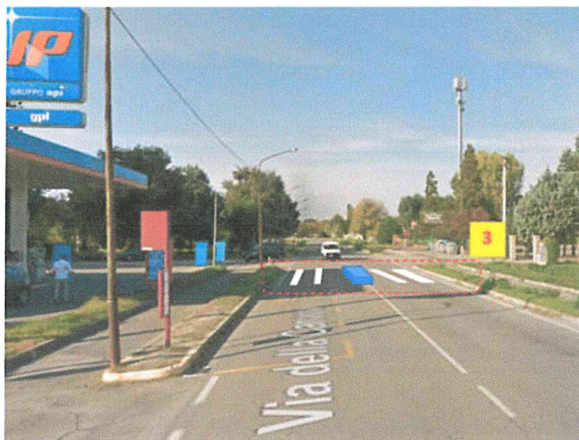
Figura 8 - Passaggio pedonale/ciclabile con isola salvagente nei pressi del distributore IP, Via Canapa (Assente, da realizzare)