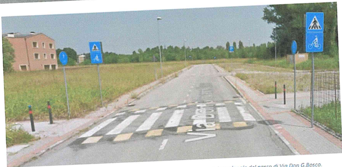
Figura 6 – (2e) Vista attuale passaggio pedonale, presso congiunzione con passaggio pedonale del parco di Via Don G. Bosco. L'attuale altezza del piano di attraversamento è inadeguata come limitatore di velocità.