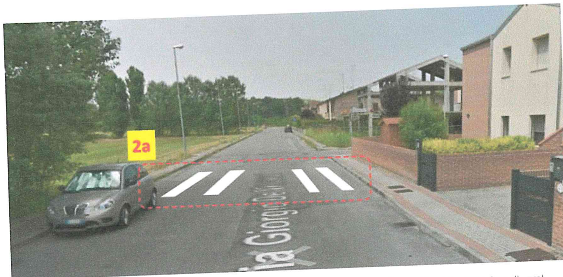
Figura 2 - (2a) Passaggio pedonale rialzato nei pressi di via De Vincenzi n. 6, crocevia Via Don G. Bosco (Assente; da realizzare).