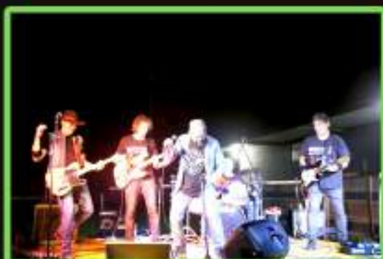
FRONT HUMP CAMELS (inediti e cover southern rock)

Intervento di sensibilizzazione a scopo benefico: Associazioni SBF FERRARA e AID