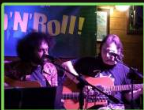
TANGERINES Acoustic Duo (tribute Led Zeppelin)