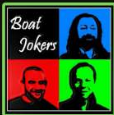
BOAT JOKERS (inediti Rock italiano)