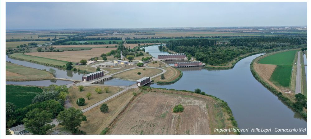
Impianti idrovori Valle Lepri - Comacchio (Fe)

Il Consorzio di Bonifica Pianura di Ferrara è un ente pubblico di diritto associativo, nato nel 2009 dalla fusione dei precedenti consorzi, che provvede alla realizzazione e gestione di opere di difesa e regolazione idraulica, all'approvvigionamento delle acque per uso irriguo in agricoltura e alla salvaguardia dell'equilibrio ambientale.