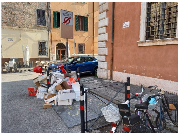
Figura 3 foto del 07/10/2023