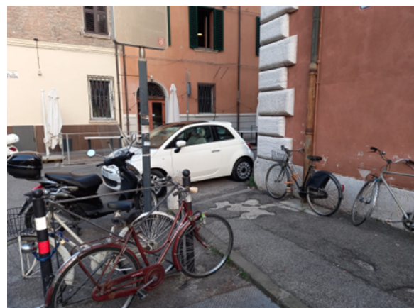
Figura 4 foto del 09/10/2023