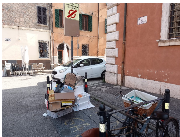
Figura 2 foto del 06/10/2023