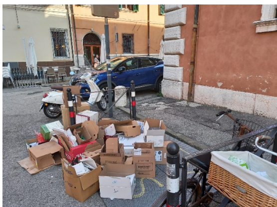
Figura 1- foto del 05/10/2023