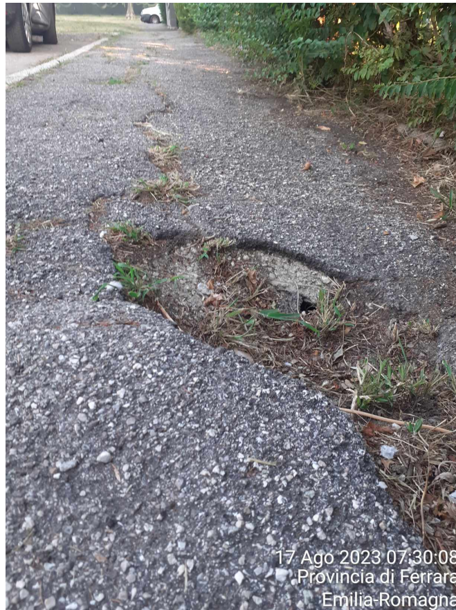
17 Ago 2023 07:30:08 Provincia di Ferrara Emilia-Romagna